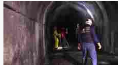
Genova, viaggio nel rifugio antiaereo di piazza Palermo